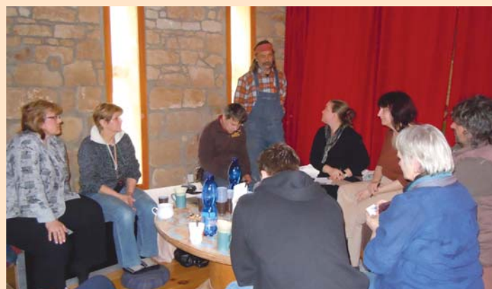
Schůzka výkonné rady Vyhlídek,o.s. Březen 2011 Osinalice