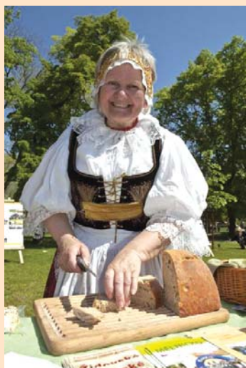
Má vlast; Vyšehrad - květen 2011