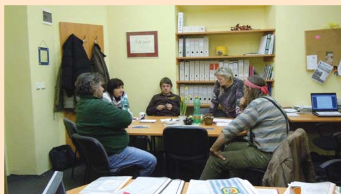
Výběrová komise při hodnocení projektů; únor 2011